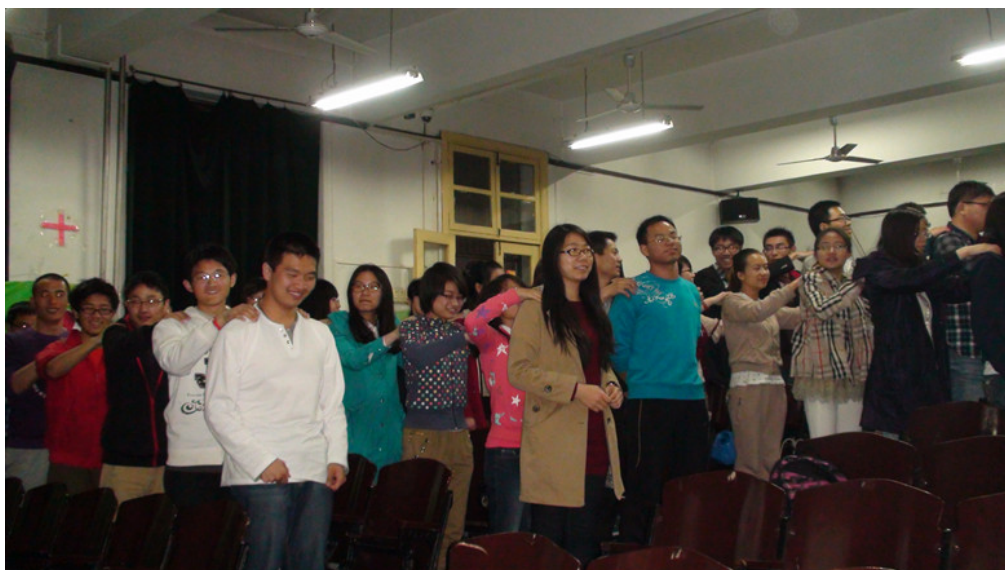
“健康宝宝，快乐成长”北医幼儿园营养健康讲座